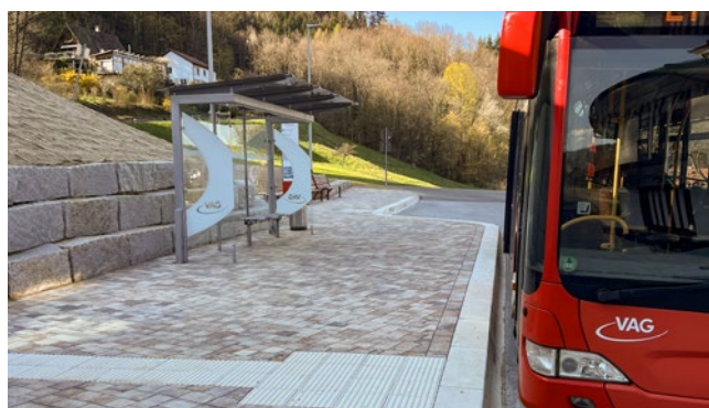
Arrêt de bus de la station du téléphérique du Schauinsland

Vous trouverez d'autres renseignements sur les transports en commun de Fribourg sur www.vagf.de . Vous pouvez y consulter tous les plans de bus et les plans de réseaux et vous renseigner au préalable sur les accès sans barrières. Toutes les informations sont réunies dans la brochure „sans barrières et en tout confort“ que vous pouvez consulter sous forme de PDF à télécharger.