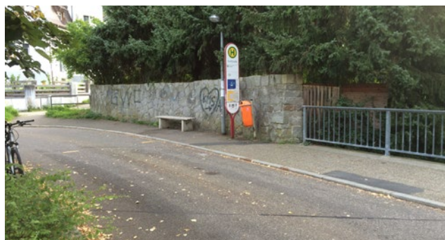
Arrêt de bus rue Dorfstraße

L'arrêt de bus à la station aval est équipé de la bordure spéciale de Kassel. La possibilité de s'approcher très près, combinée à la hauteur du trottoir contrasté, permet un accès sans obstacle aux moyens de transport.