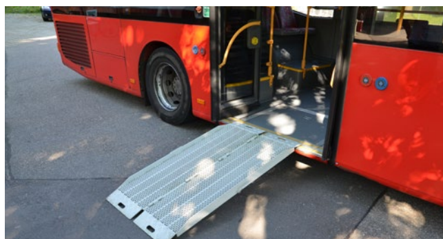
Montée et descente par rampe d'accès