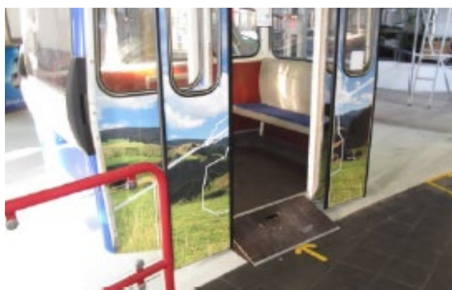
Accès à l'aide d'une rampe mobile