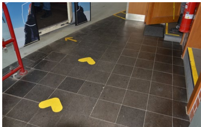
Zone de fil d'attente pour l'accès aux télécabines