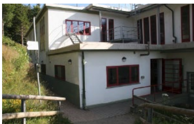
Zone de sortie de la station d'altitude