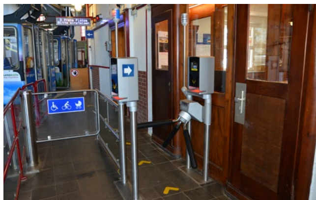
Zone d'accès aux télécabines

Arrivé à la station aval, vous avez à nouveau la possibilité de descendre à l'aide d'une rampe. Vous aurez suffisamment de place devant la rampe pour la descendre sans problème. La distance entre la rampe et le mur est de 2 m.