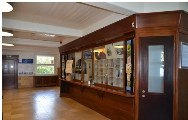
Espace intérieur de la station d'altitude

L'accès au bâtiment se fait via un escalier de 6 marches avec rambarde ou via une rampe. La rampe a une inclinaison de max. 13%, il est ainsi possible d'accéder au bâtiment en fauteuil roulant ou avec une poussette. Veillez au fait que la rampe suive un angle comme vous pouvez le voir sur la photo de l'entrée de la station d'altitude (voir 1ère photo sous 4.1). Vous trouverez les dimensions exactes sur le plan d'accès pour personnes à mobilité réduite.