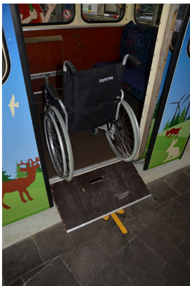
Accès aux télécabines