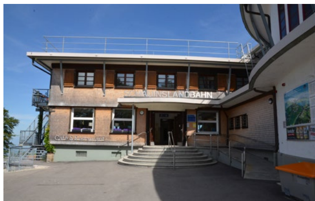
Zone d'accès de la station d'altitude

Lorsque vous vous trouvez devant l'entrée de la station d'altitude, vous voyez l'espace extérieur du café-restaurant die Bergstation sur votre gauche. Cet espace extérieur est pourvu en été de quatre grands bancs pour pique-niques et de quatre chaises-longues en bois; il est accessible sans barrières. Afin d'accéder aux bancs sans problème, vous aurez peut-être besoin d'aide, car la différence de hauteur par rapport au sol est variable. Derrière l'espace pique-nique, il vous est également possible d'accéder sans aucune barrière à la vue sur la vallée du Rhin.