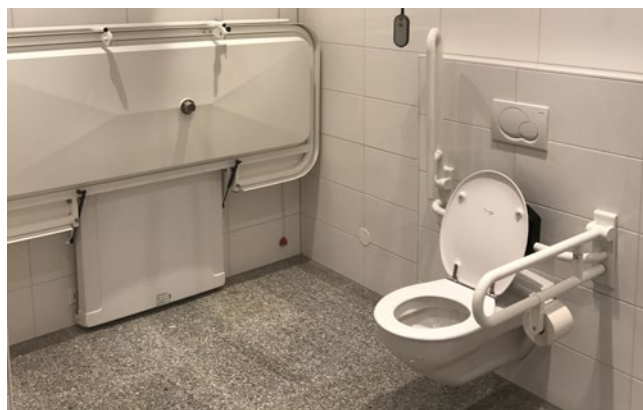
Toilettes handicapés de la station aval

Une poubelle à couches anti-odeurs se trouve également dans les toilettes de la station aval.