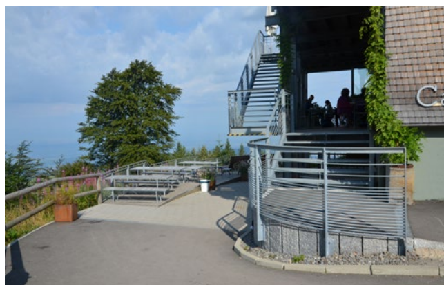
Espace extérieur de la station d'altitude