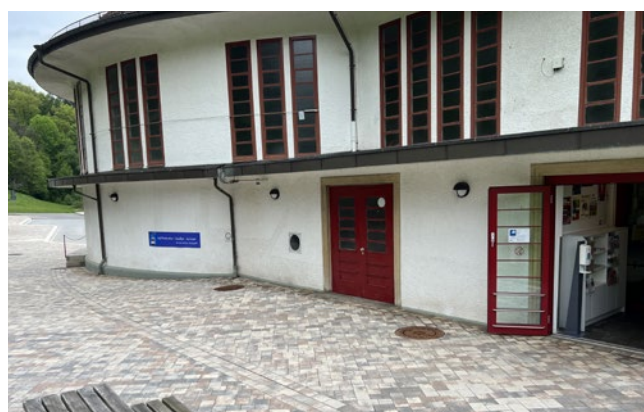
Sortie de la station aval