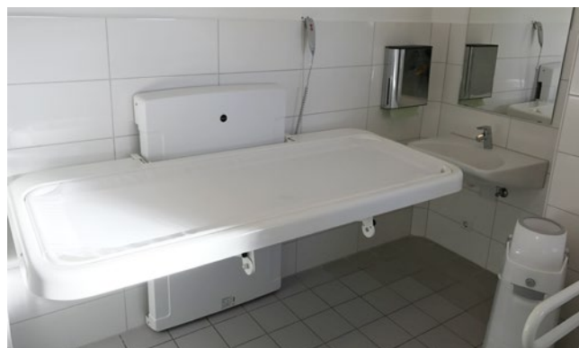
Toilettes handicapés de la station d'altitude

Une poubelle à couches anti-odeurs se trouve également dans les toilettes de la station d'altitude.