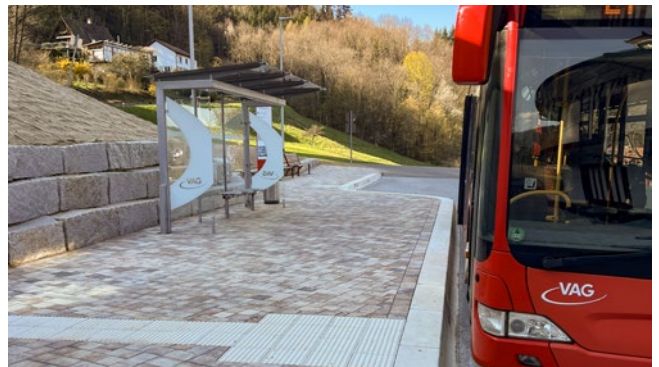
Arrêt de bus de la station du téléphérique du Schauinsland

Vous trouverez d'autres renseignements sur les transports en commun de Fribourg sur www.vagf.de . Vous pouvez y consulter tous les plans de bus et les plans de réseaux et vous renseigner au préalable sur les accès sans barrières. Toutes les informations sont réunies dans la brochure „sans barrières et en tout confort“ que vous pouvez consulter sous forme de PDF à télécharger.