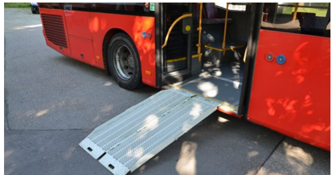
Montée et descente par rampe d'accès