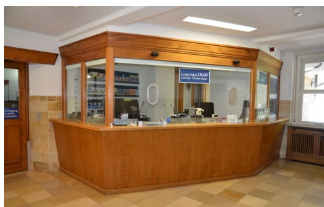
Guichet de la station aval