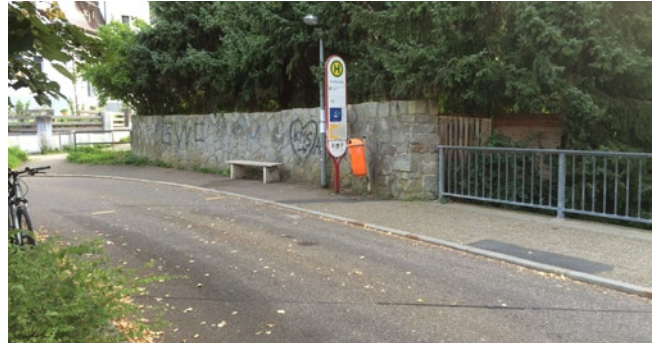
Arrêt de bus rue Dorfstraße

L'arrêt de bus à la station aval est équipé de la bordure spéciale de Kassel. La possibilité de s'approcher très près, combinée à la hauteur du trottoir contrasté, permet un accès sans obstacle aux moyens de transport.