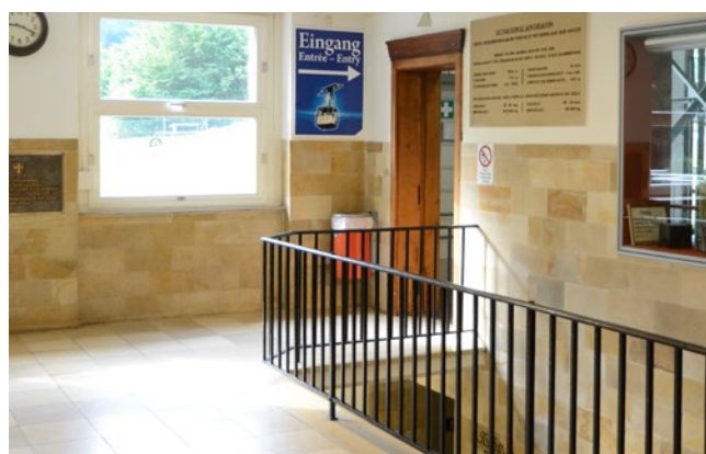
Portes automatiques menant aux télécabines