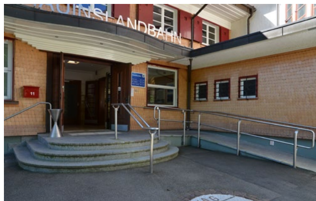
Zone d'accès de la station aval

Si après votre séjour sur le Schauinsland, vous souhaitez rentrer en téléphérique à la station aval, descendez vers la gauche dans le sens de la marche et dirigez vous tout droit directement vers la sortie. Vous pouvez quitter le bâtiment par la rampe illustrée à droite. La large zone de sortie a une inclinaison de moins de 6%. Vous trouverez les dimensions exactes sur le plan d'accès pour personnes à mobilité réduite.